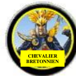
TABLEAU DES FAVEURS DE QUETE

Ces points de vie ou attaques supplémentaires ne sont pas des augmentations permanentes aux caractéristiques du chevalier, une fois utilisées elles sont défaussées.