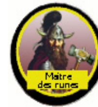
Pion du Maître des runes