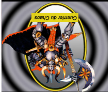
Guerrier du Chaos