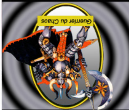
Guerrier du Chaos