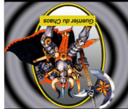
Guerrier du Chaos